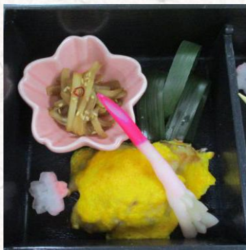
・うどの金平 ・鱧のあけぼの焼き