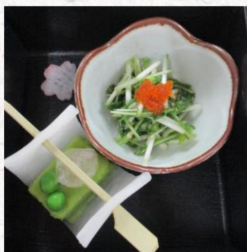
・水菜のポン酢和え ・鶯豆腐