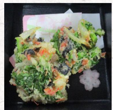
・菜の花と桜海老のかき揚げ

「春はあけぼの」夜が徐々に明けはじめ、東の空がほのかに明るく色づいてきた状態を表す言葉だそうです。「うっすらと淡く赤く染まる色」を表しているそうです。