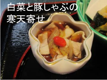
白菜と豚しゃぶの寒天寄せ