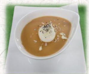
紅茶のパンナコッタ

ハンバーグは、ベーコンを巻いていつもと違う雰囲気・・・ マーマレードとバルサミコ酢を加えたソースは、加熱することで酸味が飛んでコクがあります。